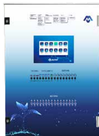
Armario con sinóptico de metacrilato