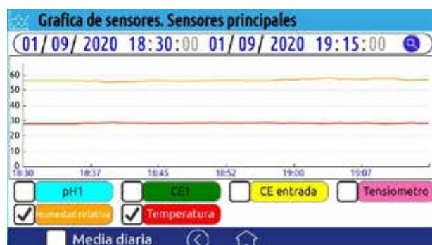
Pantalla gráfica de sensores

- Consultas para un período de tiempo personalizado - Marcar / desmarcar sensores para su visualización en gráfica - Media diaria: Valor medio diario del sensor seleccionado