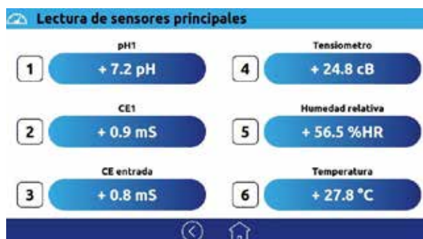
Pantalla lectura de sensores

- Visualización de las lecturas de los sensores conectados al programador