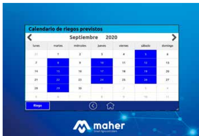
Pantalla calendario de riegos previstos