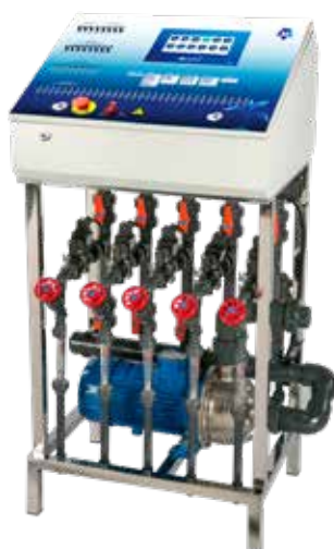
Caja pupitre con sinóptico de metacrilato