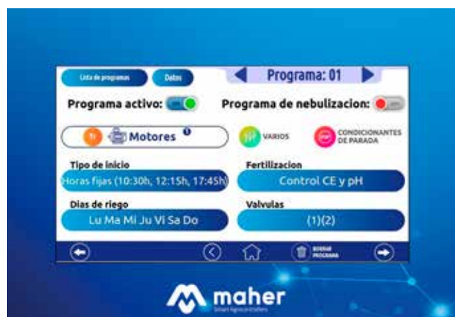
Pantalla de programación de riego

Puede ejecutar simultáneamente un programa de riego y un programa de nebulización.