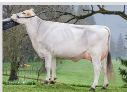
Brown Swiss: VICTORY Fink