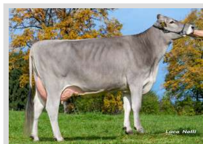
Brown Swiss: VICTORY Ragu